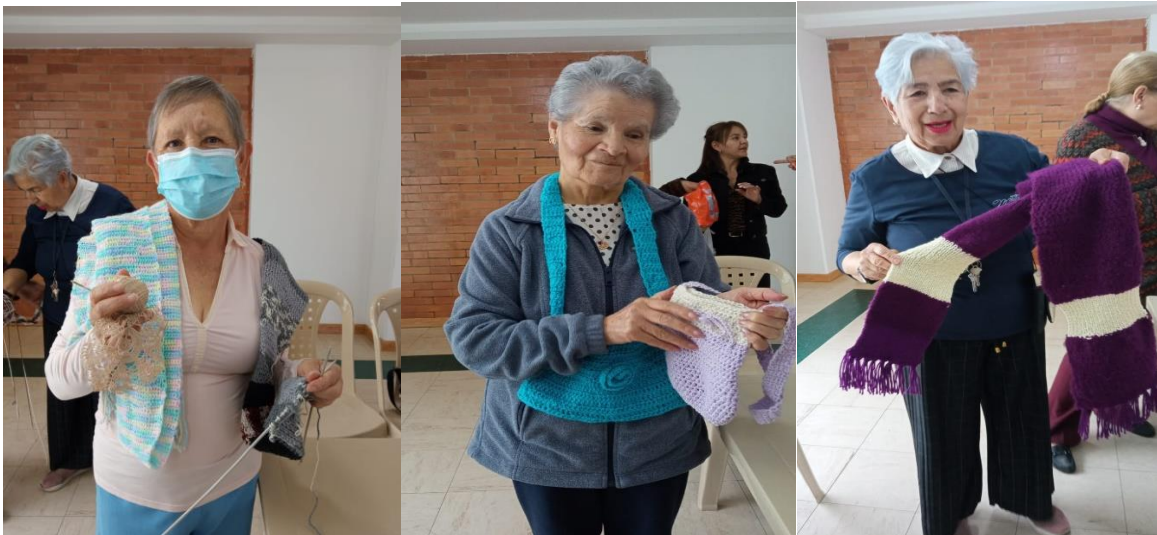
Rosalba Apto 4-1001 2 BUFANDAS Y 1 CARPETA - María Cecilia Apto. 6-801 2 BOLSOS -Martha Apto 2-104 BUFANDA