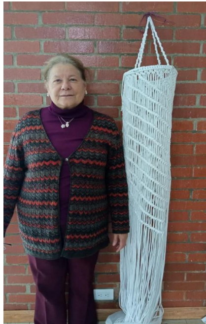
Gladys Apto 4-103 LÁMPARA